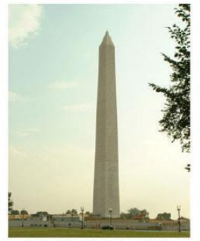
بنای یادبود جرج واشنگتن در ایالات متحده